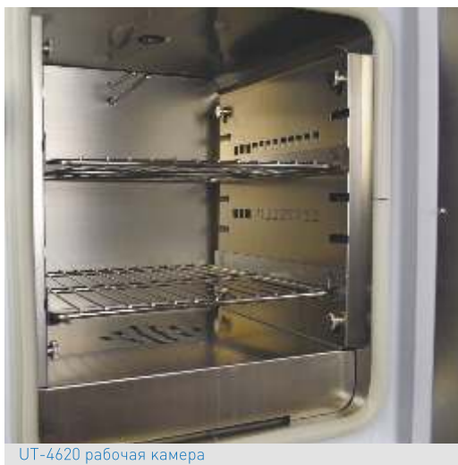
UT-4620 рабочая камера