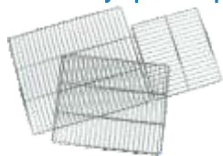
Дополнительные полки из нержавеющей стали