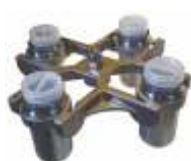
UC-4000E 4*100 мл