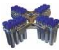
UC-4000E 32*15 мл