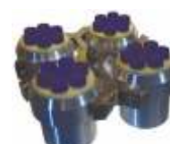
UC-1536E 24*10 мл