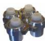
UC-1536E 4*250 мл