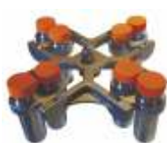
UC-4000E 8*50 мл