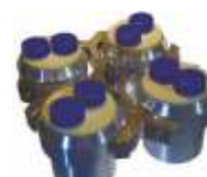
UC-1536E 8*50 мл