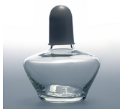
9-3-150 Спиртовка с колпачком, 150 мл